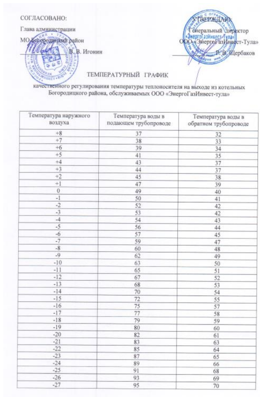
Рисунок 1 - Температурный график

1.3.7 Фактические температурные режимы отпуска тепла в тепловые сети и их соответствие утвержденным графикам регулирования отпуска тепла в тепловые сети