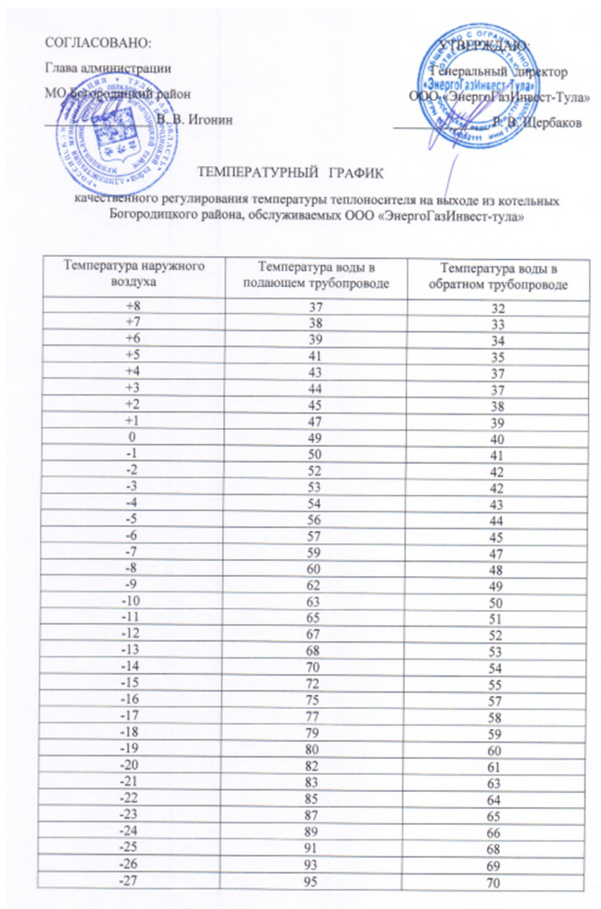
Рисунок 1 - Температурный график

Регулирование отпуска теплоты осуществляется качественно по температурному графику 95/70 оС. Изменение температурного графика не предполагается.